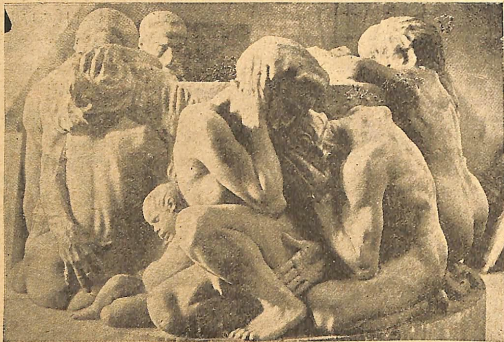
Ի.Վ.Ն. ՄԷՍՏՐՐՕՎ, ԵԶ. — Չարիւրանքի փոթորիկներ