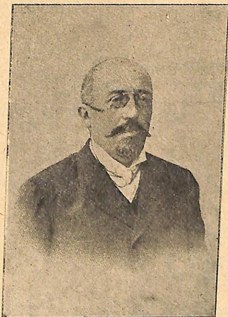
ՄՍԼՔՈՆ, ԿՈՒՐՃԵԱՆ (ՀԲԱՆԳԻ)

ջափակը և ոչ այլ քաղաքներու գեղազարդուած գերեզմանատունները: Անիկա անծայրածիր տարածութիւն մը ունի, Արաբիոյ անապատներէն մինչեւ Կովկասի սառնապատ սարերը, Իրանի լեռնադաշտէն մինչեւ Թրակիոյ հովիտները, անոր շրջապատին մէջ են, և անիկա լեցուն է, ոչ միայն գերեզմաններով, այլ դէզ դէզ դիակներու կոյտերով, խոշտանգուած, ջարդակոտոր, և ջախջախուած մարմիններու բլրակներով: