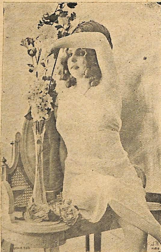
ԴԱՆԻԷԼ ՎԱՐՈՒԺԱՆ այս պատահական մուսաէն ներ- շնչուած է հետեւեալ կրակոտ զերթուածը, զոր կը հրատա- քակենք անտիպ ըլլալուն համար:

Տարեկան առէ ինչ որ անցած է և Երեւանի հասակը քառու ժողով Պատգոստեւ ըստ ինչպէս է և ինչ Բարս անհարկի անհարկի և ինչ Պատգոստեւ ըստ ինչպէս է և ինչ Ան ինչպէս է և ինչպէս է և ինչպէս է Երբ որ ինչպէս է և ինչպէս է և ինչպէս է Ինչ որ ինչպէս է և ինչպէս է և ինչպէս է Ինչ որ ինչպէս է և ինչպէս է և ինչպէս է Ինչ որ ինչպէս է և ինչպէս է և ինչպէս է