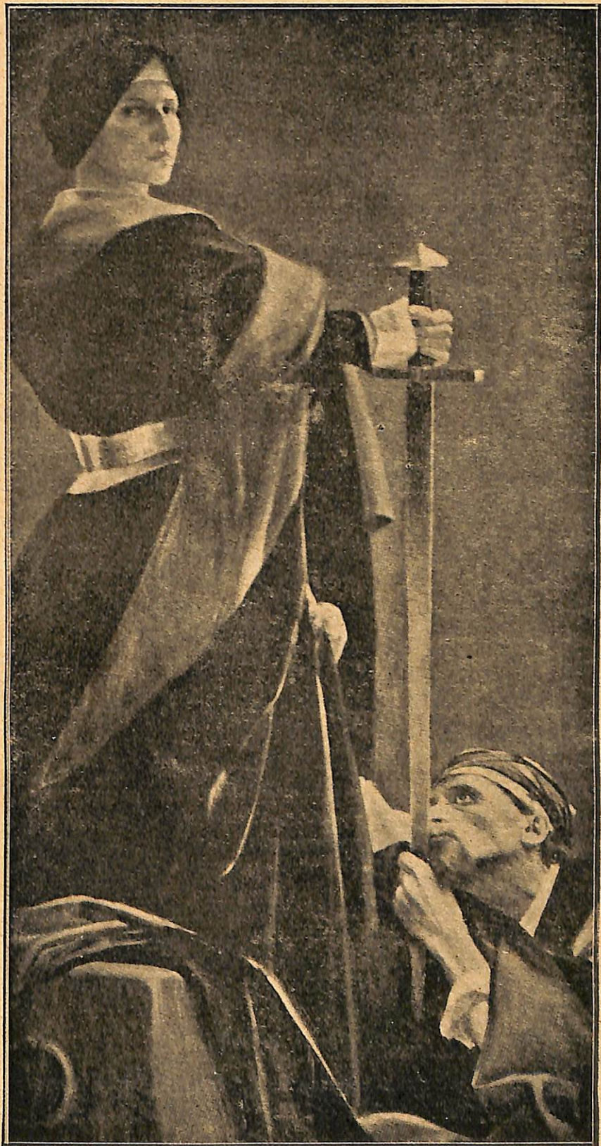
Ա. Ա. Ա. Ա. — Օրէնք

Մեզ տրամադրուած վակոնները, յայտնի կան- խահոգութիւնով մը հանգստաւէտ են. պատանդին ճակատագիրը չէ վճռուած տակաւին, և նենգու- թիւնը պէտք կը տեսնէ վերապահ նկատումներ ունենալու: Երկու կողմի հոծ մթութեան պատե- րուն մէջէն, որոնք մեր լոյսերով կը լուսաւոր-