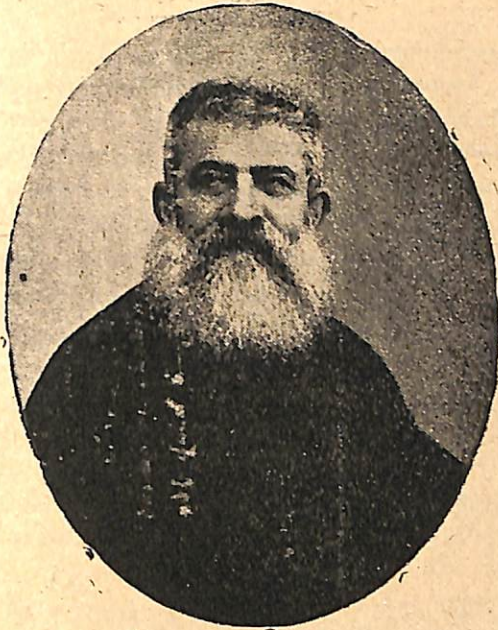
ՍՂԻՇԷ ԱՐԲ. ԴՈՒՐԵԱՆ