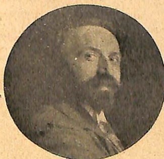
Մ. Ա. ԶՕՊԱՐԻՇ