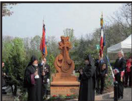
2012 L'ossuaire et le khatchkar du cimetière.