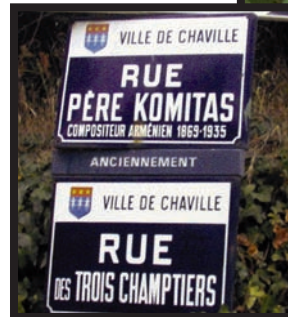
1984 La rue Père Komitas.