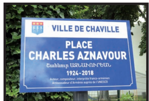
2019 La Place Charles Aznavour.