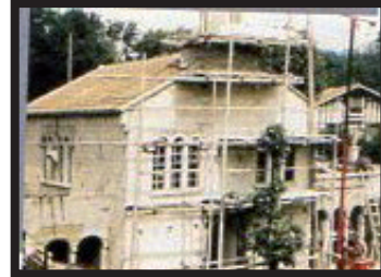
1957 La nouvelle église en construction.