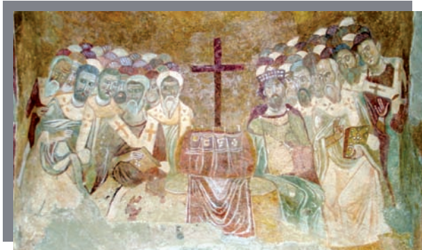
Représentations du concile de Chalcedoine.

A l'exception des Syriens diophysites (improprement appelés « nestoriens ») qui se sont séparés des autres chrétiens au concile d'Ephèse en 431, il est communément