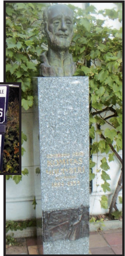
1985 Le buste du R.P. Komitas sur le parvis de l'église.