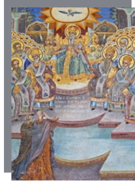
Représentations du concile de Chalcedoine.

admis par l'ensemble des spécialistes de l'histoire chrétienne que c'est le concile de Chalcedoine qui se teint en 451, auquel quelques Églises dites orientales ne purent ou ne voulurent participer, qui constitue par l'absence de ces Églises, le principal critère de classification.