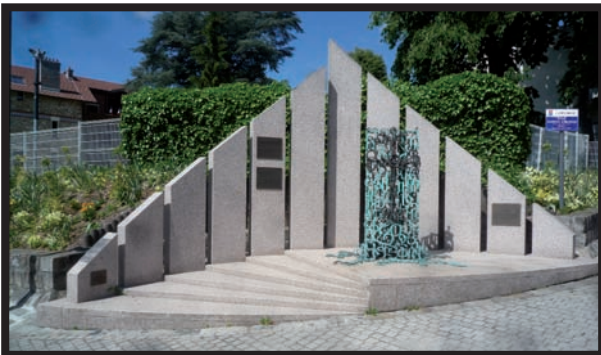
2002 Le monument arménien.