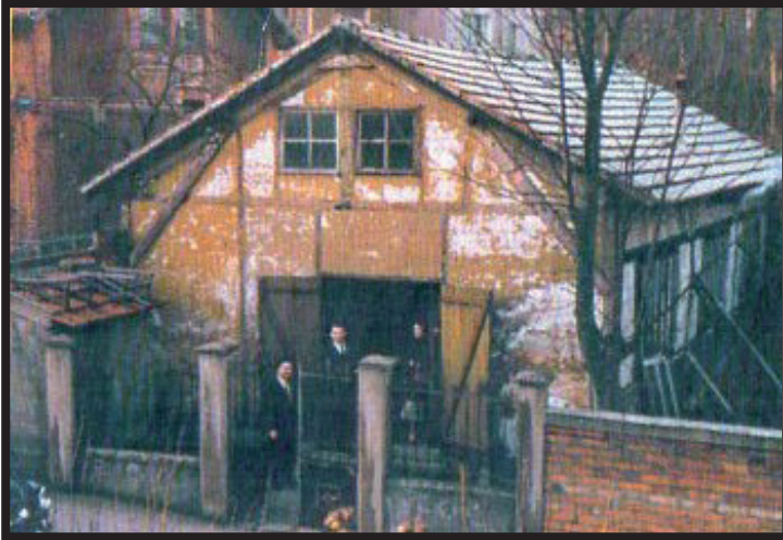
1934 Le hangar où s'est déroulée la 1 ère messe.